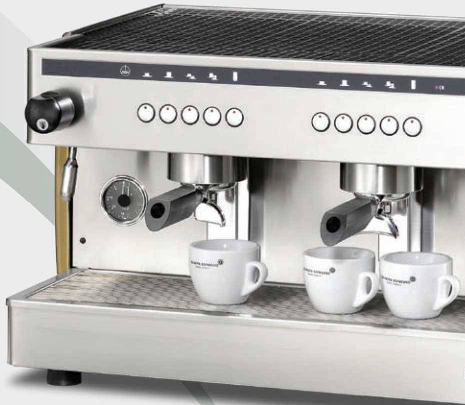
Semiautomatic 2 groups