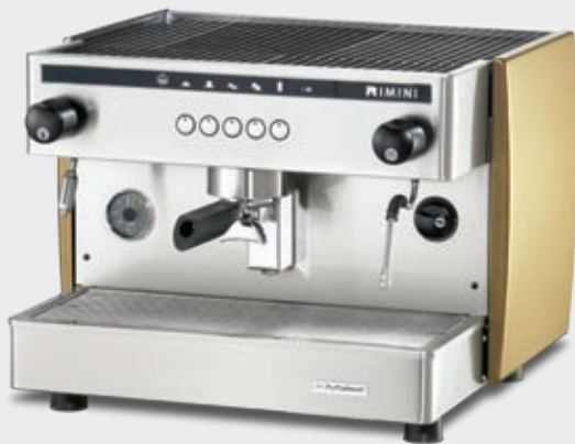
Electronic 1 group